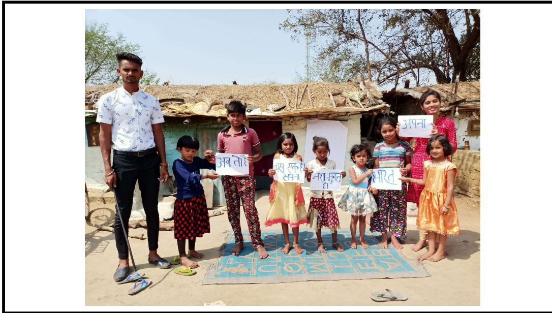
स्वयं सेवको द्वारा ग्राम कोनी में नशे के प्रति जागरूकता